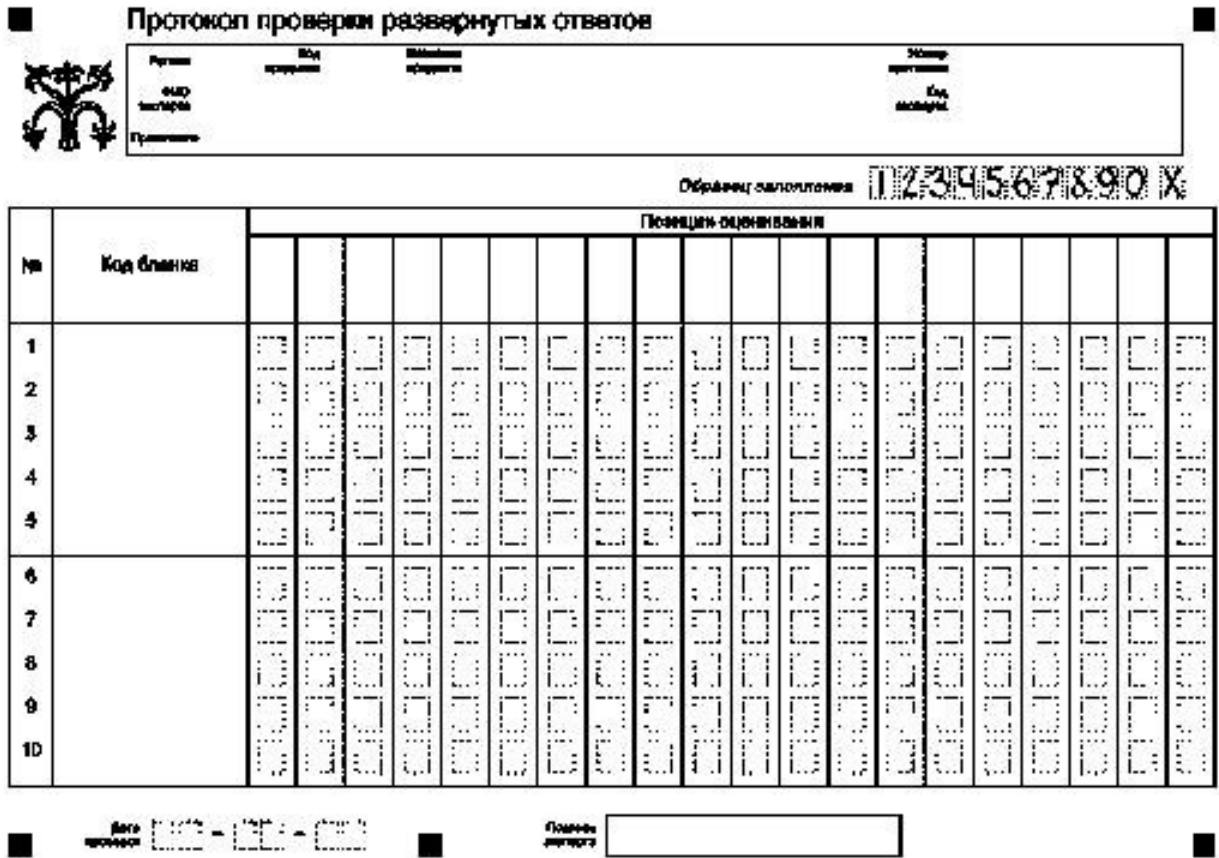
Рис. 1. Протокол проверки развернутых ответов

Верхняя часть протокола заполняется автоматизированно (рис. 1). В левой части протокола автоматизированно заполнены коды бланков работ, которые были назначены эксперту.